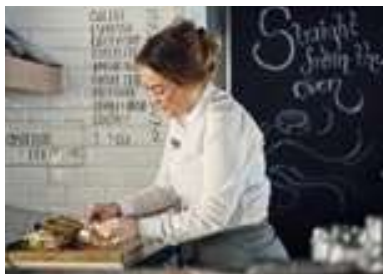
Pâtisserie « Multe »