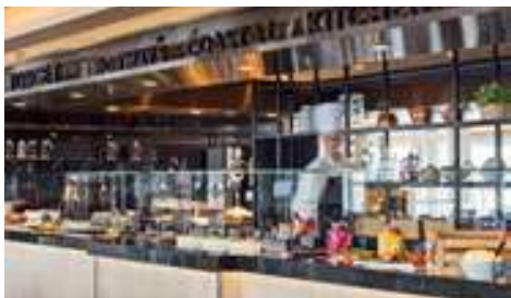
Restaurant principal Torget