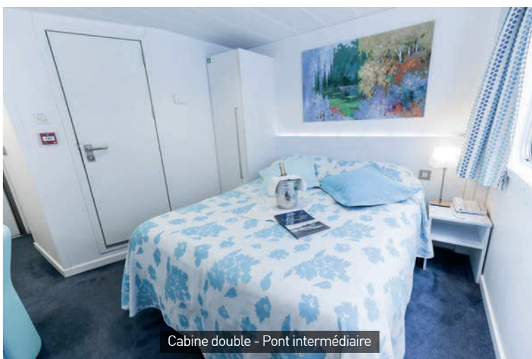
Cabine double - Pont intermédiaire