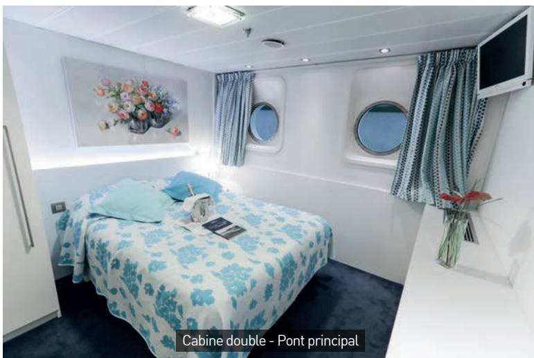
Cabine double - Pont principal