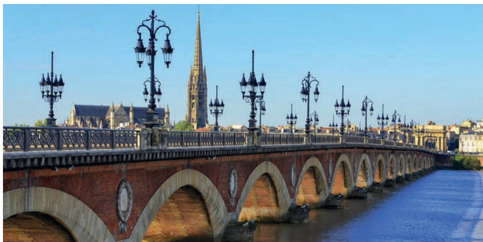
[De gauche à droite] : Bordeaux - France • Le MS Cyrano de Bergerac sur la Garonne - France • Le MS Cyrano de Bergerac • Le salon du MS Cyrano de Bergerac • Bordeaux - France