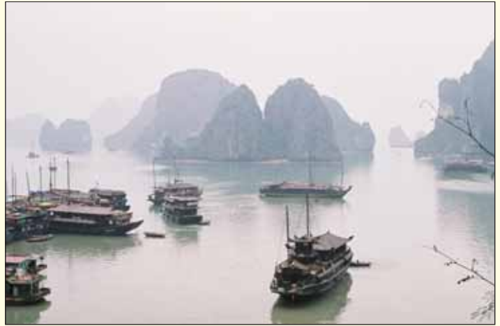
Baie d'Halong (Vietnam)

Ce prix comprend: vol régulier hors taxes d'aéroport, hébergement en hôtels **** en chambre double et 1 nuit sur un bateau à aube, la pension complète, les visites et excursions mentionnées au programme, le guide local, l'assistance rapatriement, frais de visa inclus.